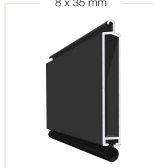
8 x 35 mm