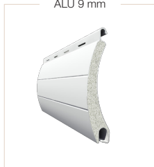
ALU 9 mm